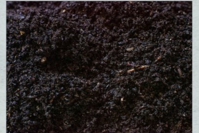
Solucan gübresi / vermicompost