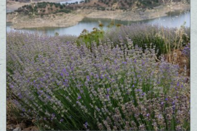
Aromatik Bitkiler / Aromatic plants