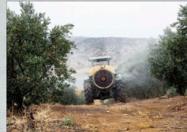
Solucan gübresi çayı / vermicompost tea