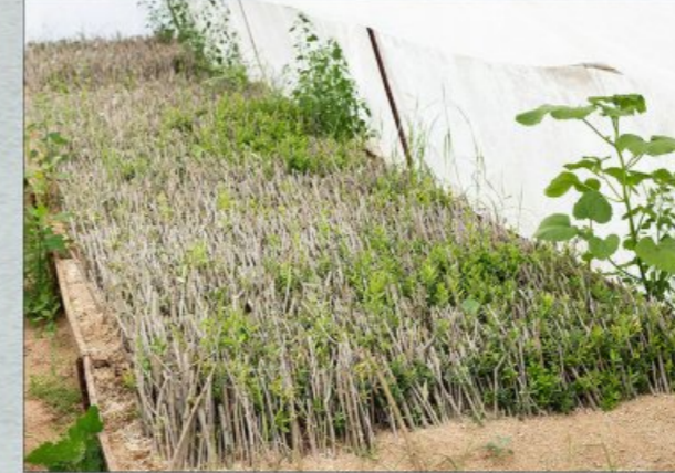
Fidanlık / Nursery