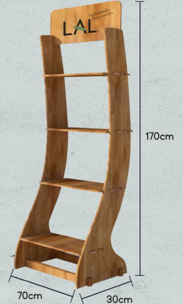
Satış standımız / Our sales stand